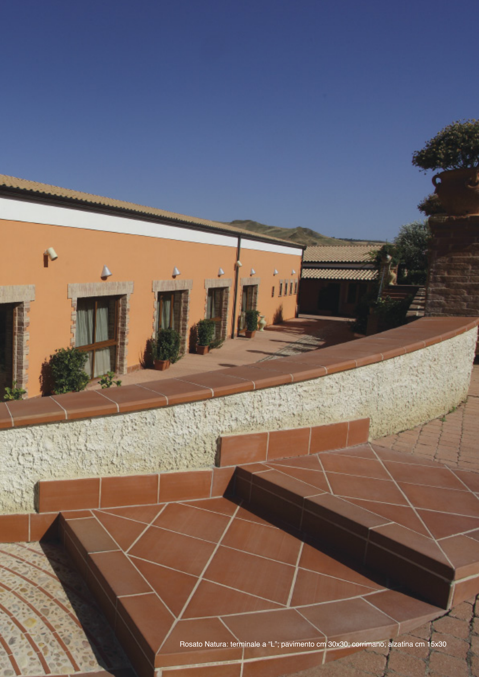
Rosato Natura: terminale a "L"; pavimento cm 30x30; corrimano; alzatina cm 15x30