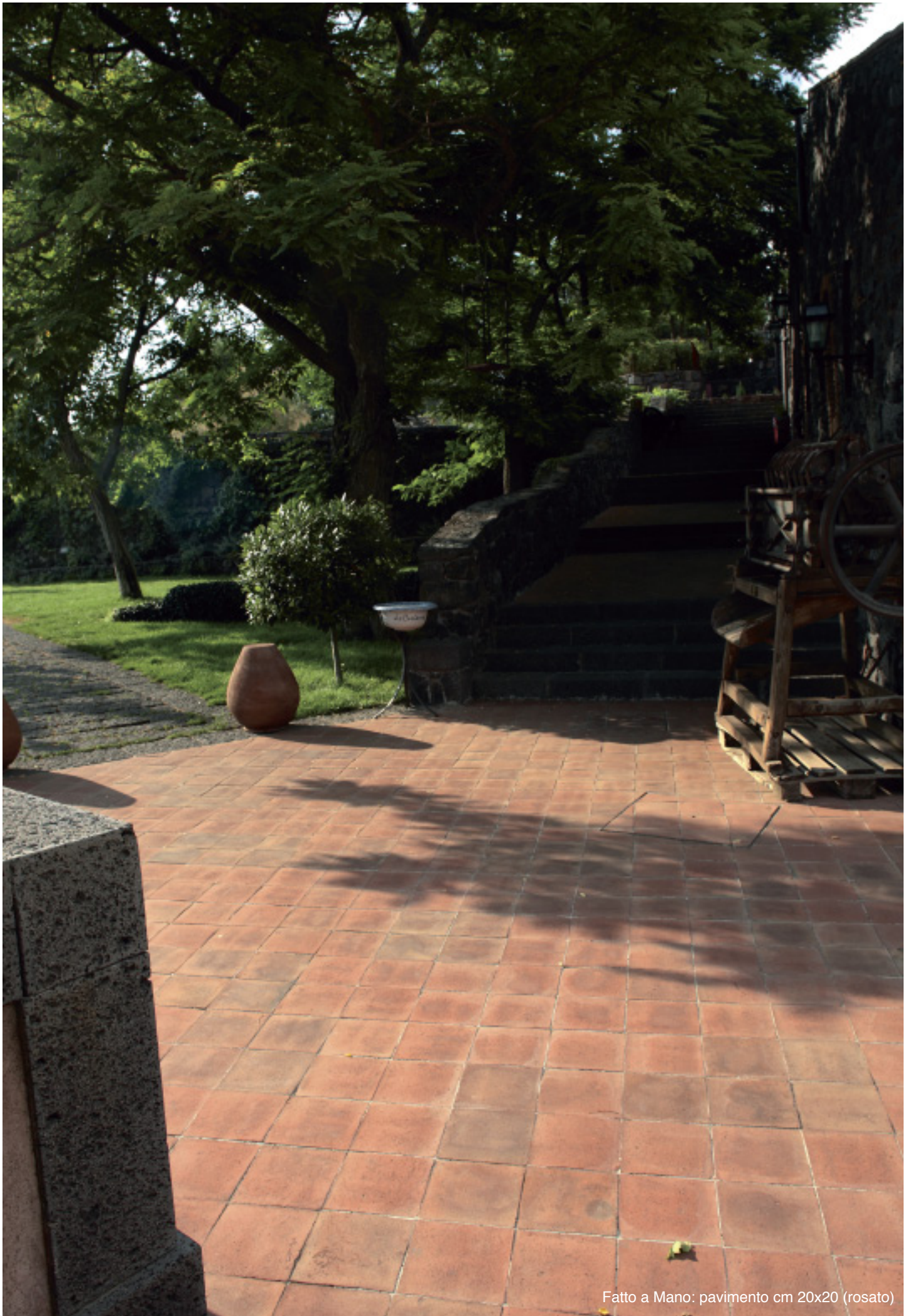
Fatto a Mano: pavimento cm 20x20 (rosato)